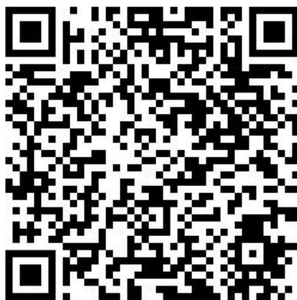
QR descarga APP

( https://play.google.com/store/apps/details?id=appinventor.ai_silvio_riesco.ConfigAlarma&hl=es )